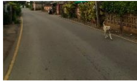
7.หน้าบ้านชายของป่าแจ่ม = 1 หลอด