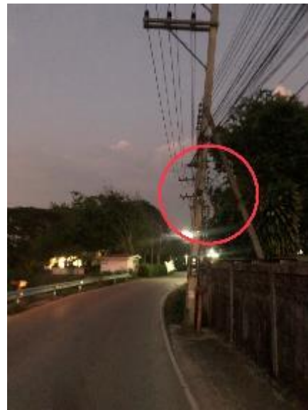
3.หน้าร้านลานคณยาย = 1 หลอด