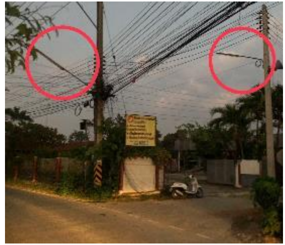
จุดโคมไฟสาธารณะตามท้องถนนบ้านด 1.ชอย 1 = จำนวน 3 หลอด