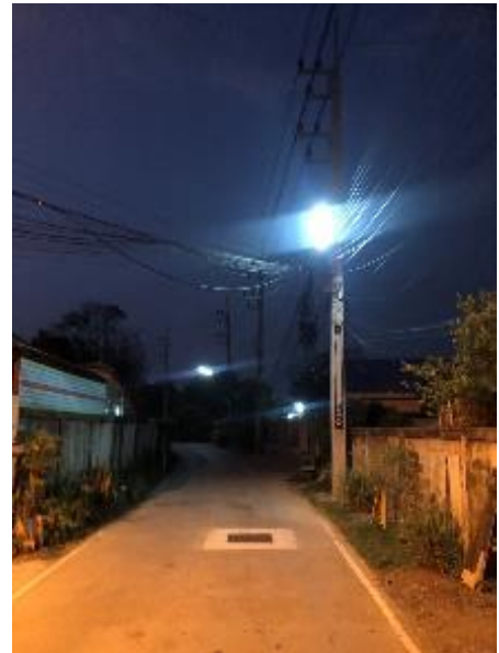
โคมหลอดไฟโดนลมพัดเปลี่ยนทิศทาง