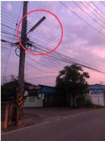
2.ชอย 2 = จำนวน 1 หลอด