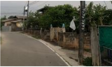
8.ใน ช.14 = 1 หลอด