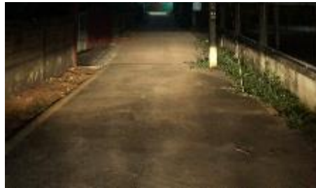
9.ใน ช. 13 = 1 หลอด