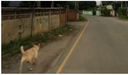
6.หน้าบ้านแม่แสงเทียน = 1 หลอด