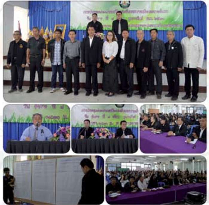
๗ กุมภาพันธ์ ๒๕๖๐ ประชุมประชาคมเมืองเทศบาล เมืองเขลางค์นคร ณ ห้องประชุมอำเภอเมืองลำปาง