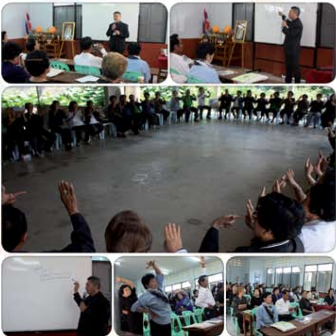
บรรยากาศการทำกิจกรรมโครงการศูนย์ผู้สูงอายุ เทศบาลเมืองเขลางค์นคร ณ ศูนย์ผู้สูงอายุตำบลชมพู