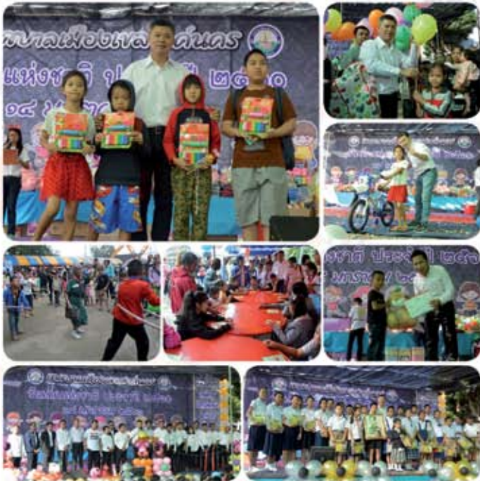
๑๔ มกราคม ๒๕๖๐ วันเด็กแห่งชาติ เทศบาลเมืองเขลางค์นคร ณ ลานเอนกประสงค์ ชุมชนบ้านลำปางกลางตะวันตก ต.ปงแสนทอง