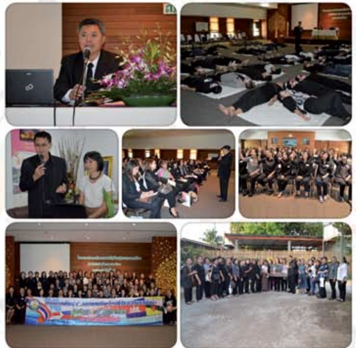
๔-๕ มีนาคม ๒๕๖๐ อบรมและศึกษาดูงานคณะกรรมการ พัฒนาสตรีเทศบาลเมืองเขลางค์นคร ณ จังหวัดเชียงใหม่