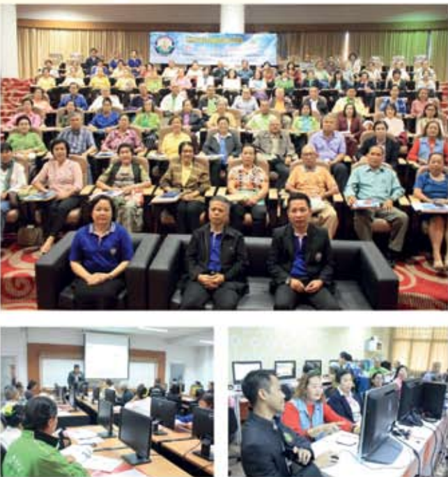
๑๒-๑๓ ธันวาคม ๒๕๖๑

กิจกรรมเก็บขยะและทำความสะอาดตามโครงการรณรงค์รักษาสิ่งแวดล้อม Big Cleaning Day ถนนวิภาวดีดำเนิน ตำบลพระบาท