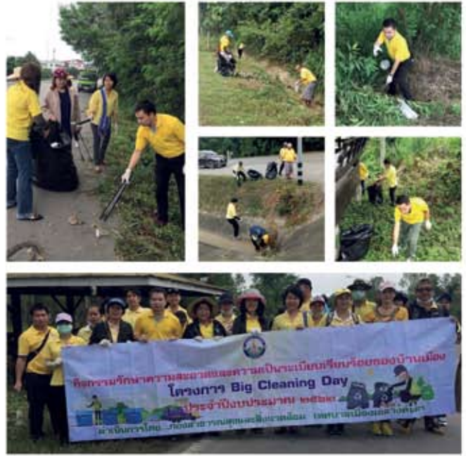
๑๒ ตุลาคม ๒๕๖๑

Big Cleaning Day วัดพุมหุลวง (โครงการวัด ประชา รัฐ สร้างสุข)