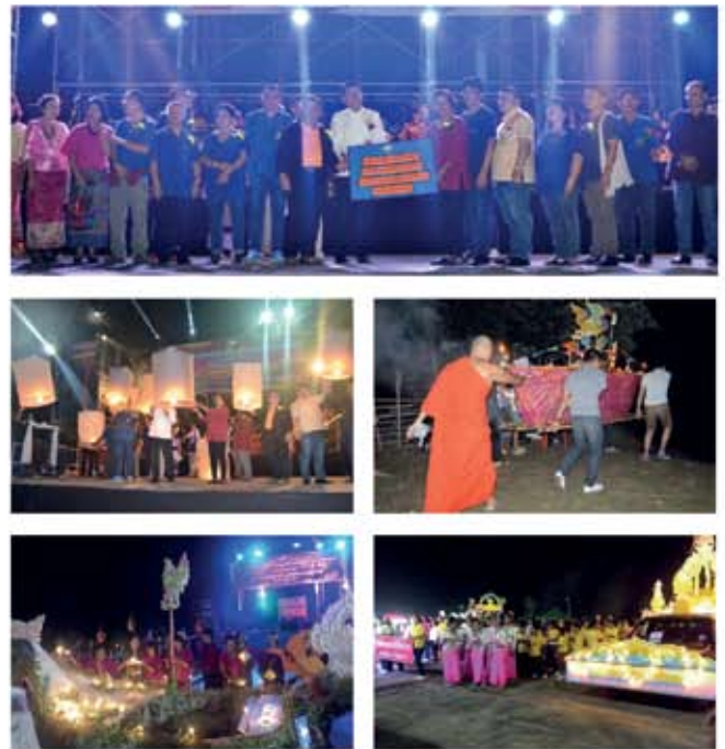
๒๕ ตุลาคม ๒๕๖๑

อบรมการใช้เทคโนโลยีและการใช้สื่อโซเชียลให้กับผู้สูงอายุ ณ มหาวิทยาลัยราชภัฏลำปาง