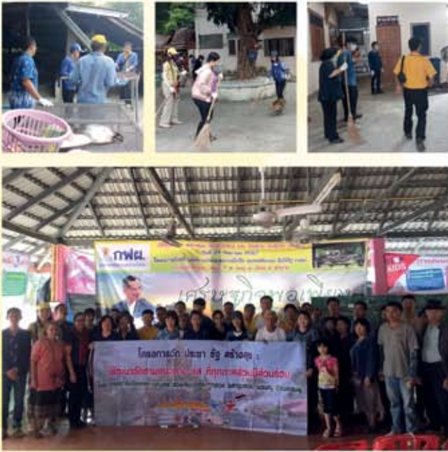
๑๒ ตุลาคม ๒๕๖๑

Big Cleaning Day วัดพุมหุลวง (โครงการวัด ประชา รัฐ สร้างสุข)