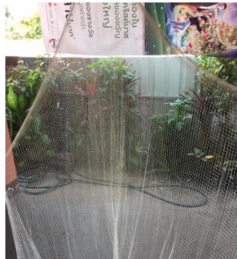
การสานแหจับปลา