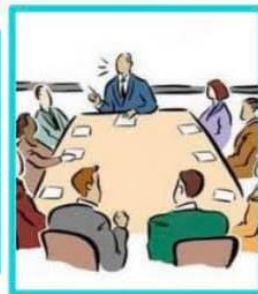
3. คณะกรรมการพัฒนาท้องถิ่นพิจารณาร่างแผนพัฒนาท้องถิ่น