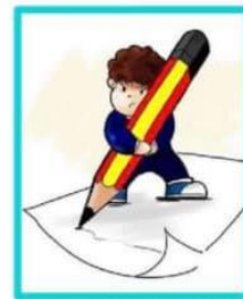
4. ผู้บริหารท้องถิ่นอนุมัติแผนพัฒนาท้องถิ่น