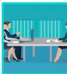
2. คณะกรรมการสนับสนุนการจัดทำแผน รวบรวมแนวทางและข้อมูล จัดทำร่างแผนพัฒนาท้องถิ่น