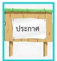
6. ผู้บริหารท้องถิ่นประกาศใช้แผนพัฒนาท้องถิ่น